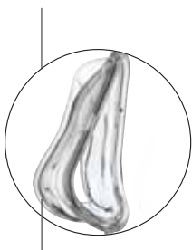
Membrana – widok boczny uszczelki twarzowej

Ruchoma membrana uszczelki koło podbródka zapewnia szczelność i pozwala na ruch żuchwy