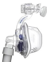
ACTIVA LT S, M, L, LW