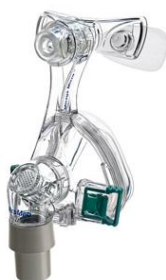
MICRO S, M, L, LW, XL

TWARZOWA LIBERTY: maska obejmująca usta z wkładkami do nosa, brak wsparcia na czoło;