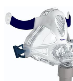
QUATTRO FX S, M, L