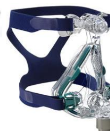
QUATTRO XS, S, M, L