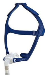
SWIFT LT S, M, L