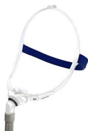
SWIFT FX XS, S, M, L