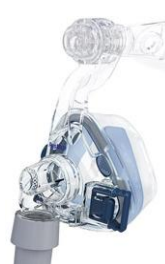
SOFTGEL S, M, L, LW